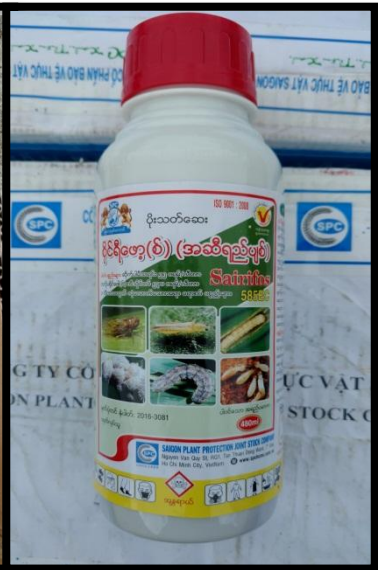
Saipora (မှီသတ်ဆေး) , Sairifos (ပိုးသတ်ဆေး) တားဆီးမှု မှတ်တမ်းခါတ်ပုံ