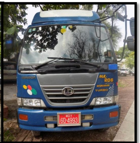
အမိုနီယမ် နိုက်ထရိတ်ဟုယူဆ ရသော မြေဆီအိတ် တားဆီးမှု မှတ်တမ်းခါတ်ပုံ