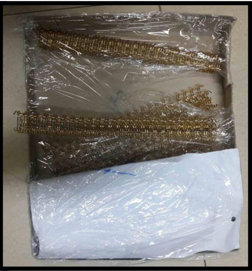
Wire Binder, Insert CNMG, Insert CAMPT 1603 PDER for shell end mill, Insert CNMG တားဆီးမှု မှတ်တမ်းခါတ်ပုံ