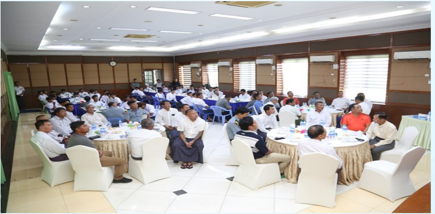
စီမံကိန်းနှင့်ဘဏ္ဍာရေးဝန်ကြီးဌာန၊အကောက်ခွန်ဦးစီးဌာန၊ ကိုယ်စားပြုအမျိုးသားဘောလုံးအသင်းအား တွေ့ဆုံမှာကြားခြင်း အခမ်းအနားသို့ တက်ရောက်လာကြသည့် ဘောလုံးအသင်းအားကစားသမားများ။

စီမံကိန်းနှင့်ဘဏ္ဍာရေးဝန်ကြီးဌာနဘောလုံးအသင်း၊ အုပ်ချုပ်သူနှင့်အသင်းခေါင်းဆောင်ဖြစ်သူ တို့မှ ၂၀၂၄ခုနှစ်၊ပဉ္စမအကြိမ် အမျိုးသားအားကစားပွဲတော် ဝန်ကြီးဌာနပေါင်းစုံဘောလုံး (အမျိုးသား) ပြိုင်ပွဲ တွင် စီမံကိန်းနှင့်ဘဏ္ဍာရေးဝန်ကြီးဌာန၊ ဘောလုံးအသင်းအနေဖြင့် အကောင်းဆုံးကြိုးစား၍ အစဉ်အလာ ကောင်းများကို ထိန်းသိမ်းကာအနိုင်ယူဗိုလ်စွဲနိုင်ရေး ဆောင်ရွက်သွားမည်ဖြစ်ပါကြောင်း ကတိပြုပြောကြား ခဲ့ပါသည်။ ဆက်လက်၍ အစီအစဉ်အရ စီမံကိန်းနှင့်ဘဏ္ဍာရေးဝန်ကြီးဌာန ဘောလုံးအသင်းမှ နိုင်ငံ့လက်ရွေး စင်ကစားသမားဟောင်းများသည် ၎င်းတို့၏ အတွေ့အကြုံများနှင့်နှိုင်းယှဉ်၍ နေထိုင်လေ့ကျင့်ကြိုးစား ယှဉ်ပြိုင်နိုင်ရန်၊ ရှောင်ကြဉ်ရန်နှင့် လိုက်နာရန်များကို လမ်းညွှန်မှာကြားအားပေးစကား ပြောကြားခဲ့ပါသည်။