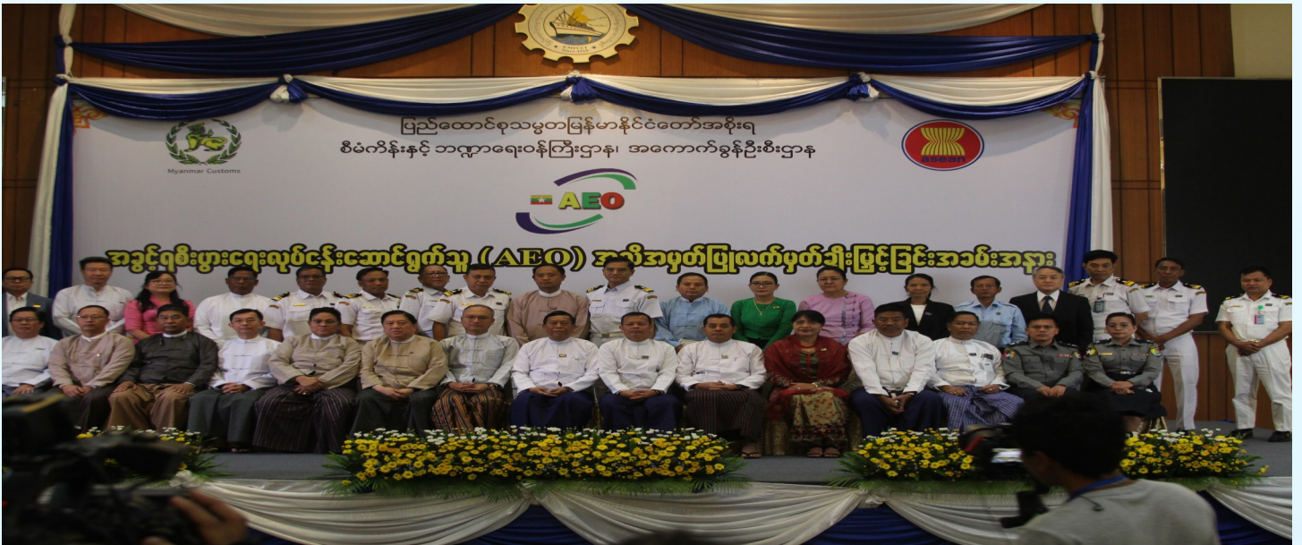
အကောက်ခွန်ဦးစီးဌာန၊ အခွင့်ရစီးပွားရေးလုပ်ငန်းဆောင်ရွက်သူ (Authorized Economic Operators-AEO) အသိအမှတ်ပြုလက်မှတ်ချီးမြှင့်ခြင်း အခမ်းအနားသို့တက်ရောက်လာကြသည့် တာဝန်ရှိသူများနှင့်အသင်းအဖွဲ့များ။

AEO Program ကို ကမ္ဘာ့အကောက်ခွန်အဖွဲ့ (WCO) မှ ကုန်သွယ်မှုလွယ်ကူချောမွေ့စေရေးနှင့် လုံခြုံမှုရှိစေရန်အတွက် ကုန်သွယ်မှုဆိုင်ရာလုံခြုံမှုမူဘောင် (Safe Framework of Standard)၊ ကမ္ဘာ့ကုန်သွယ်ရေးအဖွဲ့၏ ကုန်သွယ်မှုလွယ်ကူချောမွေ့စေရေးဆိုင်ရာ သဘောတူညီချက် (WTO Trade Facilitation Agreement) ၏ Article 7.7 နှင့် အာဆီယံကုန်စည်ကုန်သွယ်ရေးသဘောတူညီချက် (ASEAN Trade in Goods Agreement-ATIGA) သဘောတူညီချက် Article (59) တို့အရ အာဆီယံအဖွဲ့ဝင်နိုင်ငံများမှ AEO Program ကို အကောင်အထည်ဖော်ဆောင်ရွက်ရမည်ဖြစ်ပါသည်။