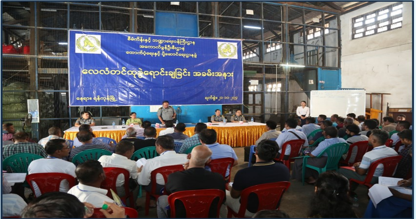
အကောက်ခွန်ဦးစီးဌာန၊ ထောက်/ပို့ဌာနခွဲရှိ ပြည်သူ့ဘဏ္ဍာအဖြစ် သိမ်းဆည်းထားသည့်ထုခွဲအဆင့်ရောက် အမှုတွဲများအား အဖွဲ့ဝင်များ၏ ရှေ့မှောက်၌ လေလံတင်ထုခွဲရောင်းချခြင်း အခမ်းအနားကျင်းပစဉ်။

အကောက်ခွန်ဦးစီးဌာန၊ ထောက်/ပို့ဌာနခွဲရှိ ပြည်သူ့ဘဏ္ဍာသိမ်း ထုခွဲ/ ဖျက်ဆီး အဆင့်ရောက် အမှုတွဲ (၃၉) မှုကို Lot (1) အမှုတွဲ (၉) မှု Packing Materials များ၊ Plastic Resin၊ Plastic Scrap များနှင့် အထွေထွေပစ္စည်းများ၊ Lot(2) အမှုတွဲ (၁၀) မှု Pre-painted galvanized iron sheet in coilများ၊ Ceramic Tiles များနှင့် အထွေထွေပစ္စည်းများ၊ Lot (3) အမှုတွဲ (၁၀) မှု Wellman အားဖြည့်ဆေး၊ Sport Shoes များနှင့် အထွေထွေပစ္စည်းများ၊ Lot(4) အမှုတွဲ(၁၀)မှ Pre-painted galvanized iron sheet in coil များ၊ ပိတ်စများနှင့် အထွေထွေပစ္စည်းများခွဲ၍ ၂၁-၁၁-၂၀၂၄ ရက်နေ့ ၁၀:၀၀ နာရီတွင် ညွှန်ကြားရေးမှူး (ထောက်/ပို့) ဦးဆောင်၍ ဒုတိယညွှန်ကြားရေးမှူး၊ လက်ထောက်ညွှန်ကြားရေးမှူးနှင့် အဖွဲ့ဝင်များ ရှေ့မှောက်၌ လေလံတင်ထုခွဲ ရောင်းချခဲ့ပါသည်။ Lot(3) မှာ ကြမ်းခင်းဈေး မပြည့်မှီသည့်အတွက် ရောင်းချခြင်းမပြုလုပ်ခဲ့ပဲ Lot(1), Lot (2), Lot (4) မှာ ကြမ်းခင်းဈေး ပြည့်မှီသည့်အတွက် ထုခွဲရောင်းချခြင်းမှ စုစုပေါင်းတန်ဖိုးကျပ်သန်းပေါင်း ၃၀၄၂.၀၀၀ /- အခွန်ငွေ ရရှိခဲ့ပါသည်။