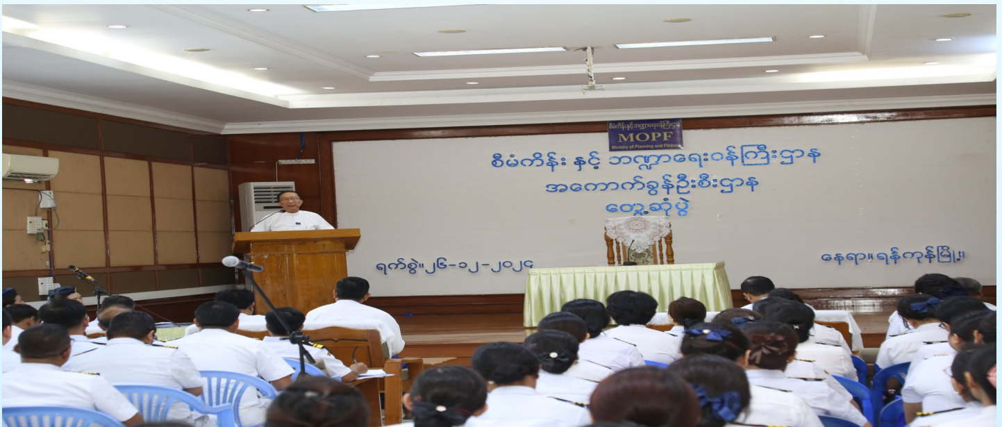
ဒုတိယဝန်ကြီးချုပ်နှင့် စီမံကိန်းနှင့်ဘဏ္ဍာရေးဝန်ကြီးဌာန၊ ပြည်ထောင်စုဝန်ကြီးမှ အကောက်ခွန်ဦးစီးဌာနရှိ ဝန်ထမ်းများနှင့်တွေ့ဆုံ၍ ဩဝါဒအမှာစကားပြောကြားစဉ်။

ဒုတိယဝန်ကြီးချုပ်နှင့် စီမံကိန်းနှင့်ဘဏ္ဍာရေးဝန်ကြီးဌာန၊ ပြည်ထောင်စုဝန်ကြီးမှ အကောက်ခွန်ဦးစီးဌာနရှိ ဝန်ထမ်းများနှင့်တွေ့ဆုံ၍ ဩဝါဒအမှာစကားပြောကြားခြင်း အခမ်းအနားကျင်းပ