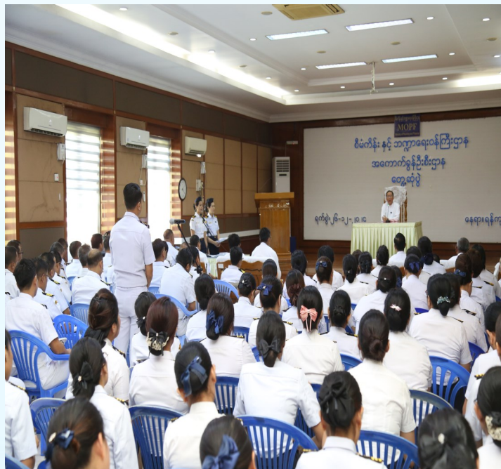
တက်ရောက်လာကြသောဝန်ထမ်းများမှ လုပ်ငန်းဆောင်ရွက်ရာတွင် တွေ့ကြုံရသောအခက်အခဲများကို ပြည်ထောင်စုဝန်ကြီးအား တင်ပြစဉ်။

ဩဝါဒစကားပြောကြားရာ၌ အကောက်ခွန်ဦးစီးဌာနသည် နိုင်ငံတော်အတွက် အခွန်ဘဏ္ဍာငွေများအား အဓိကရှာဖွေပေးရသည့်ဌာနတစ်ခုဖြစ်ကြောင်း၊ တရားမဝင်ကုန်သွယ်မှုတိုက်ဖျက်ရေးလုပ်ငန်းများတွင်လည်း အဓိကတာဝန်ယူဆောင်ရွက်ရသည့် ဌာနဖြစ်သည့်အတွက် တာဝန်ရှိသူများအနေဖြင့် သတ်မှတ်ထားသော စည်းမျဉ်းစည်းကမ်းများအတိုင်း တိကျစွာ လိုက်နာကျင့်ကြံဆောင်ရွက်ကြရန်လိုအပ်ကြောင်း၊ ထို့ပြင် ပြည်သူ့ကို ဝန်ဆောင်မှုပေးရသည့်ဌာနဖြစ်သောကြောင့် လုပ်ငန်းတာဝန်များ ထမ်းဆောင်ကြရာတွင် အဂတိတရား ကင်းရှင်းစွာဖြင့် တာဝန်ထမ်းဆောင်ရန် လိုအပ်ကြောင်း၊ လုပ်ငန်းဆောင်ရွက်ရာတွင်လည်း နိုင်ငံတော် အတွက် အကောက်ခွန်၊ ကုန်သွယ်လုပ်ငန်းခွန်၊ အထူးကုန်စည်ခွန်အစရှိသည့် အခွန်အရပ်ရပ်ကို အပြည့်အဝ ကောက်ခံနိုင်ရန် လိုအပ်ကြောင်း၊ နိုင်ငံ့ဝန်ထမ်းများဖြစ်ကြသည့်အားလျော်စွာ နိုင်ငံ့အကျိုး၊ ပြည်သူ့အကျိုး အတွက်ကြိုးပမ်းတာဝန်ထမ်းဆောင်ကြရန် လိုအပ်ကြောင်း၊ စည်းမျဉ်းစည်းကမ်းညွှန်ကြားချက်များကို လိုက်နာခြင်း၊ ဥပဒေ၊ နည်းဥပဒေများအတိုင်း ကျင့်ကြံဆောင်ရွက်ခြင်း၊ အဂတိတရားကင်းရှင်းစွာဖြင့် တာဝန်ထမ်းဆောင်ခြင်းတို့ဖြင့် နိုင်ငံ့ဝန်ထမ်းကောင်းများ ပီသစွာ ကြိုးပမ်းဆောင်ရွက်ကြစေလိုကြောင်း၊ မိမိဌာနနှင့် ဝန်ကြီးဌာနအတွက် ဂုဏ်ဆောင်ဝန်ထမ်းများဖြစ်ကြစေလိုကြောင်း တိုက်တွန်းမှာကြားခဲ့ပါသည်။ ထို့နောက် တက်ရောက်လာသူများမှ လုပ်ငန်းဆောင်ရွက်ရာတွင် ကြုံတွေ့ရသည့်အခက်အခဲများကို တင်ပြရာ ဒုတိယဝန်ကြီးချုပ်နှင့် စီမံကိန်းနှင့်ဘဏ္ဍာရေးဝန်ကြီးဌာန၊ ပြည်ထောင်စုဝန်ကြီးမှ လိုအပ်သည်များ ပေါင်းစပ်ညှိနှိုင်းဖြေရှင်းဆောင်ရွက်ပေးခဲ့ပါသည်။