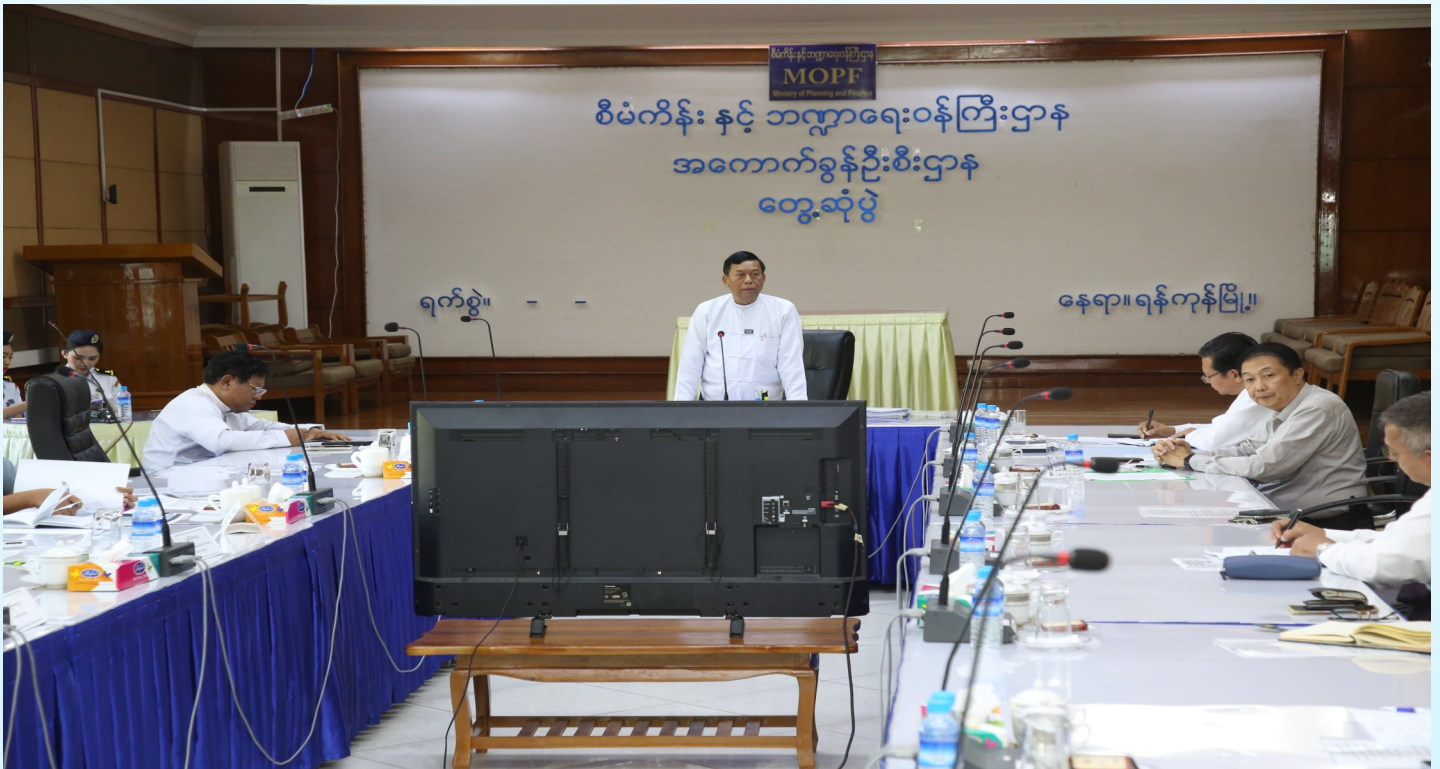
ယာယီအပြည်ပြည်ဆိုင်ရာဆိပ်ကမ်းများနှင့် ယာယီပြည်တွင်းဆိပ်ကမ်းများအား သက်တမ်းတိုးဆောင်ရွက်ခြင်းများနှင့်စပ်လျဉ်း၍ ညှိနှိုင်းအစည်းအဝေးတွင် အကောက်ခွန်ဦးစီးဌာန၊ ညွှန်ကြားရေးမှူးချုပ် ဦးသိန်းဆွေကအမှာစကားပြောကြားစဉ်။

၁၅-၁-၂၀၂၅ ရက်နေ့ ၁၄:၀၀ နာရီတွင် အကောက်ခွန်ဦးစီးဌာန (ရုံးချုပ်)၊ ဇေယျာသီဟခန်းမ၌ အကောက်ခွန်ဦးစီးဌာန၊ ညွှန်ကြားရေးမှူးချုပ်မှ ဦးဆောင်၍ ယာယီအပြည်ပြည်ဆိုင်ရာဆိပ်ကမ်းများနှင့် ယာယီပြည်တွင်းဆိပ်ကမ်းများအား သက်တမ်းတိုးဆောင်ရွက်ခြင်းများနှင့်စပ်လျဉ်း၍ ညှိနှိုင်းအစည်းအဝေးအား ကျင်းပပြုလုပ်ခဲ့ပါသည်။ အဆိုပါအစည်းအဝေးသို့ ရေကြောင်းပို့ဆောင်ရေးညွှန်ကြားမှုဦးစီးဌာန၊ မြန်မာ့ဆိပ်ကမ်းအာဏာပိုင်နှင့် ဆိပ်ကမ်းလုပ်ငန်းများလုပ်ကိုင်ဆောင်ရွက်နေသည့် ကုမ္ပဏီများမှ တာဝန်ရှိသူများ တက်ရောက်ခဲ့ကြပါသည်။