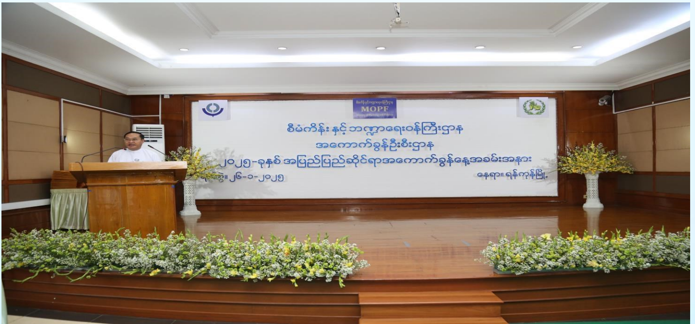
၂၀၂၅ ခုနှစ် ၊ (၃၄)ကြိမ်မြောက် အပြည်ပြည်ဆိုင်ရာအကောက်ခွန်နေ့အခမ်းအနားတွင် စီမံကိန်းနှင့်ဘဏ္ဍာရေးဝန်ကြီးဌာန၊ ဒုတိယဝန်ကြီး ဦးမင်းထွဋ်က အဖွင့်အမှာစကားပြောကြားစဉ်။

၂၀၂၅ခုနှစ်၊ (၃၄) ကြိမ်မြောက် အပြည်ပြည်ဆိုင်ရာအကောက်ခွန်နေ့အခမ်းအနားကို၂၆-၁-၂၀၂၅ ရက်နေ့တွင် ရန်ကုန်မြို့၊ အကောက်ခွန်ဦးစီးဌာန(ရုံးချုပ်)၊ ဇေယျာသီဟခန်းမ၌ ကျင်းပခဲ့ရာ စီမံကိန်းနှင့်ဘဏ္ဍာရေးဝန်ကြီးဌာန၊ ဒုတိယဝန်ကြီးဦးမင်းထွဋ်၊ရန်ကုန်တိုင်းဒေသကြီးအစိုးရအဖွဲ့စီးပွားရေးရာဝန်ကြီး၊ ကုန်သွယ်မှုနှင့်ကုန်စည်စီးဆင်းမှုများမှန်ကန်မြန်ဆန်စေရေးလုပ်ငန်းကော်မတီ အတွင်းရေးမှူး၊ စီမံကိန်းနှင့်ဘဏ္ဍာရေးဝန်ကြီးဌာနအောက်ရှိ ညွှန်ကြားရေးမှူးချုပ်များ၊ ဦးဆောင်ညွှန်ကြားရေးမှူးများ၊ အကောက်ခွန်ဦးစီးဌာန၊ ညွှန်ကြားရေးမှူးချုပ်၊ ဒုတိယညွှန်ကြားရေးမှူးချုပ်များ၊ ညွှန်ကြားရေးမှူးများ၊ အရာထမ်း/ အမှုထမ်းများ၊ ဆုရရှိသည့် ဝန်ထမ်းများနှင့် ဝန်ထမ်း သား/သမီးများ စုစုပေါင်းအင်အား (၁၂၅) ဦး တက်ရောက်ခဲ့ကြပါသည်။