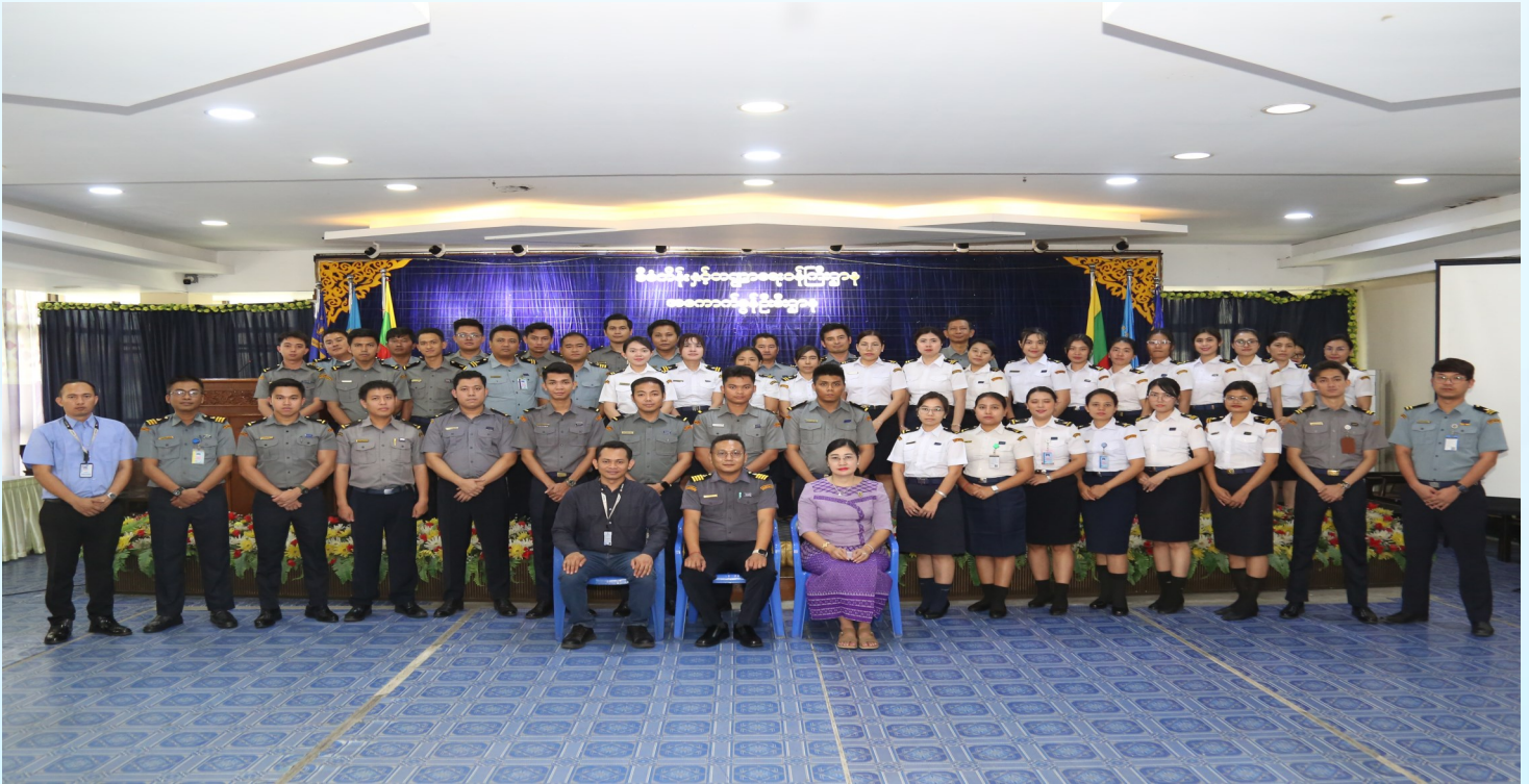
ကုန်ပစ္စည်းများသယ်ယူပို့ဆောင်ရာတွင် စောင့်ကြည့်စစ်ဆေးသည့်စနစ် (Logistics Surveillance System E-Lock) သင်တန်းဖွင့်အမှတ်တရ ဓါတ်ပုံရိုက်ကူးစဉ်။

အကောက်ခွန်ဦးစီးဌာန၊ အကောက်ခွန်သင်တန်းကျောင်း၌ ၂၈-၁-၂၀၂၅ ရက်နေ့တွင် ကုန်သေတ္တာ (Container) / အလုံပိတ်ယာဉ် (Box Truck) များနှင့်အတူ ကုန်ပစ္စည်းများသယ်ယူပို့ဆောင်ရာတွင် စောင့်ကြည့်စစ်ဆေးသည့်စနစ် (Logistics Surveillance System E-Lock) လုပ်ငန်းစဉ်များကို သိရှိနားလည်ပြီး လုပ်ငန်းခွင်တွင် ထိရောက်စွာ ဆောင်ရွက်နိုင်ရေးအတွက် E-Lock သင်တန်းကို နံနက် ၀၉:၀၀ နာရီမှ ညနေ ၁၆:၃၀ နာရီထိ ကျင်းပ ပြုလုပ်ခဲ့ပါသည်။ အဆိုပါသင်တန်းတွင် တာမိုးညဲအုပ်စုရင်းနှီးမြှုပ်နှံမှုနှင့် ဖွံ့ဖြိုးတိုးတက်မှုကုမ္ပဏီလီမိတက်၏ ကျွမ်းကျင်သူများနှင့် နယ်ရုံးများကြီးကြပ်ရေးဌာနခွဲ၊ မူဝါဒနှင့် E-Lock ဌာနစိတ်တို့မှ ကုန်သေတ္တာ (Container) / အလုံပိတ်ယာဉ် (Box Truck) များနှင့်အတူ ကုန်ပစ္စည်းများသယ်ယူပို့ဆောင်ရာတွင် စောင့်ကြည့်စစ်ဆေးသည့် စနစ် (Logistics Surveillance System E-Lock) လုပ်ငန်းစဉ်များအား ပို့ချဆွေးနွေးခဲ့ပြီး သင်တန်းသို့ ဌာနခွဲ အသီးသီးမှ သင်တန်းသား (၅၀) ဦးတို့ တက်ရောက်ခဲ့ကြပါသည်။