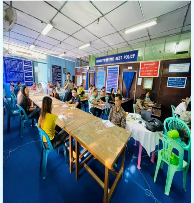
တင်သွင်း/ တင်ပို့လုပ်ငန်းရှင်များ၊ အကောက်ခွန်ဝန်ဆောင်မှုလုပ်ငန်းဆောင်ရွက်သူများအနေဖြင့် MACCS စနစ်ကို ကျွမ်းကျင်စွာအသုံးပြု တတ်စေရန် MACCS စနစ်အသုံးပြုခြင်းဆိုင်ရာ စာတွေ့လက်တွေ့သင်တန်းအား သင်တန်းဖွင့်လှစ်ခြင်း။

မြိတ်မြို့၊ ကော့သောင်းမြို့နှင့် မန္တလေးမြို့များသို့ MACCS စနစ် တိုးချဲ့ဆောင်ရွက်ရာတွင် တင်သွင်း/တင်ပို့လုပ်ငန်းရှင်များ၊ အကောက်ခွန်ဝန်ဆောင်မှုလုပ်ငန်းဆောင်ရွက်သူများအနေဖြင့် MACCS စနစ်ကို ကျွမ်းကျင်စွာအသုံးပြုတတ်စေရန် ရည်ရွယ်၍ MACCS စနစ်အသုံးပြုခြင်းဆိုင်ရာ စာတွေ့လက်တွေ့သင်တန်းအား ၁၃.၁.၂၀၂၅ ရက်နေ့မှ ၂၁.၁.၂၀၂၅ ရက်နေ့အထိ မြိတ်မြို့၊ ကော့သောင်းမြို့နှင့် မန္တလေးမြို့များရှိ သက်ဆိုင်ရာမြို့နယ်အကောက်ခွန်ဦးစီးဌာနများတွင် Video Conferencing ဖြင့် သင်တန်းပို့ချဖွင့်လှစ်ခဲ့ပါသည်။