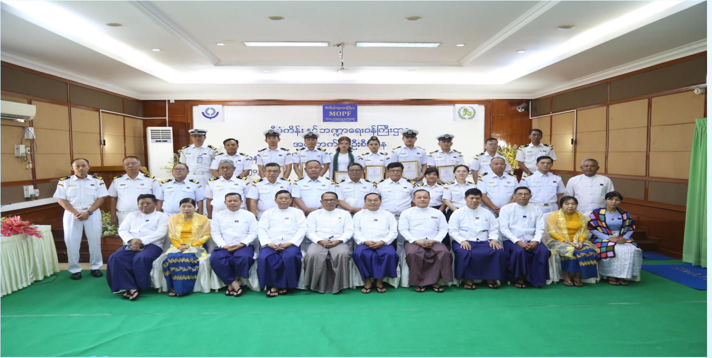
၂၀၂၅ ခုနှစ် ၊ ၃၄၂ ကြိမ်မြောက် အပြည်ပြည်ဆိုင်ရာအကောက်ခွန်နေ့အခမ်းအနားတွင် မှတ်တမ်းတင်ခါတ်ပုံရိုက်ကူးစဉ်။