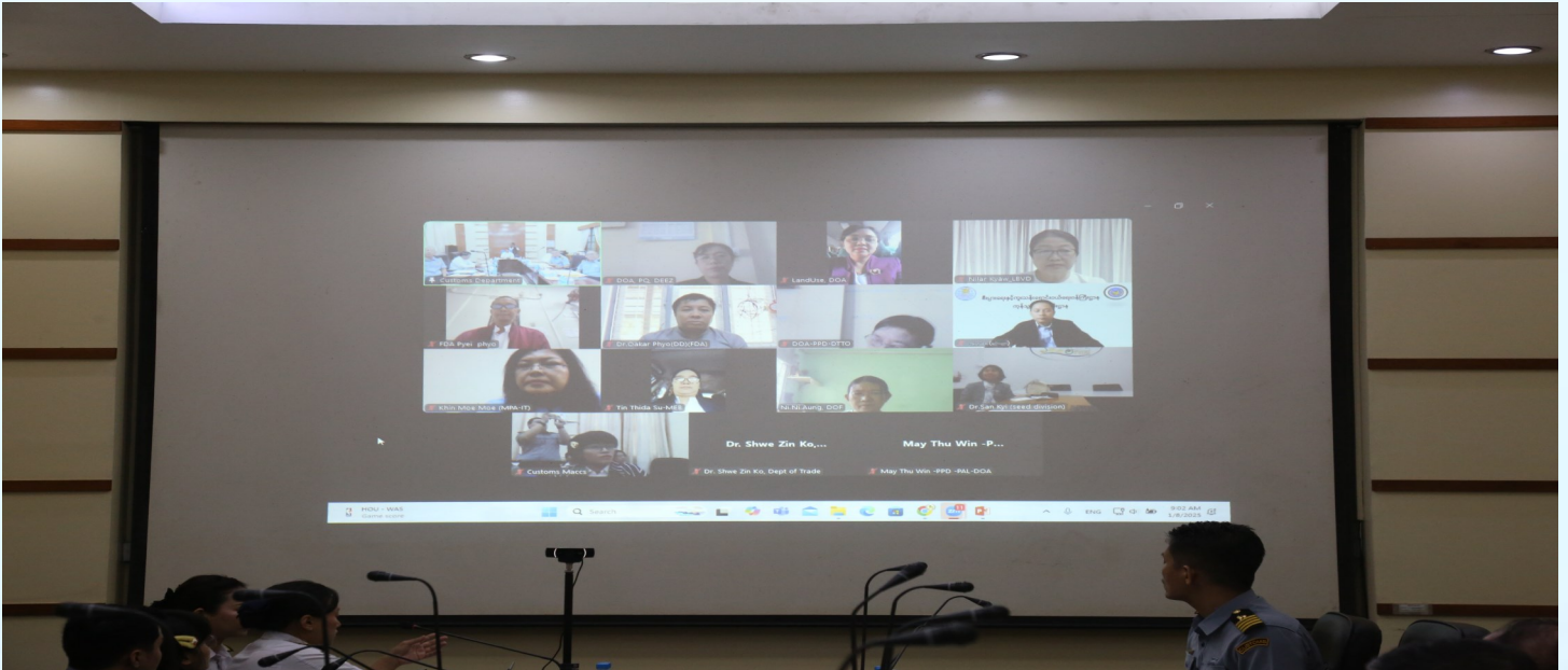
ပြတင်းတစ်ပေါက်စနစ်ဆိုင်ရာလုပ်ငန်းများ အကောင်အထည်ဖော်ရေးအဖွဲ့၏အဓိကအဖွဲ့ဝင်ဌာနများ၏တာဝန်ရှိသူများက Online Virtual စနစ်ဖြင့် တက်ရောက်စဉ်။