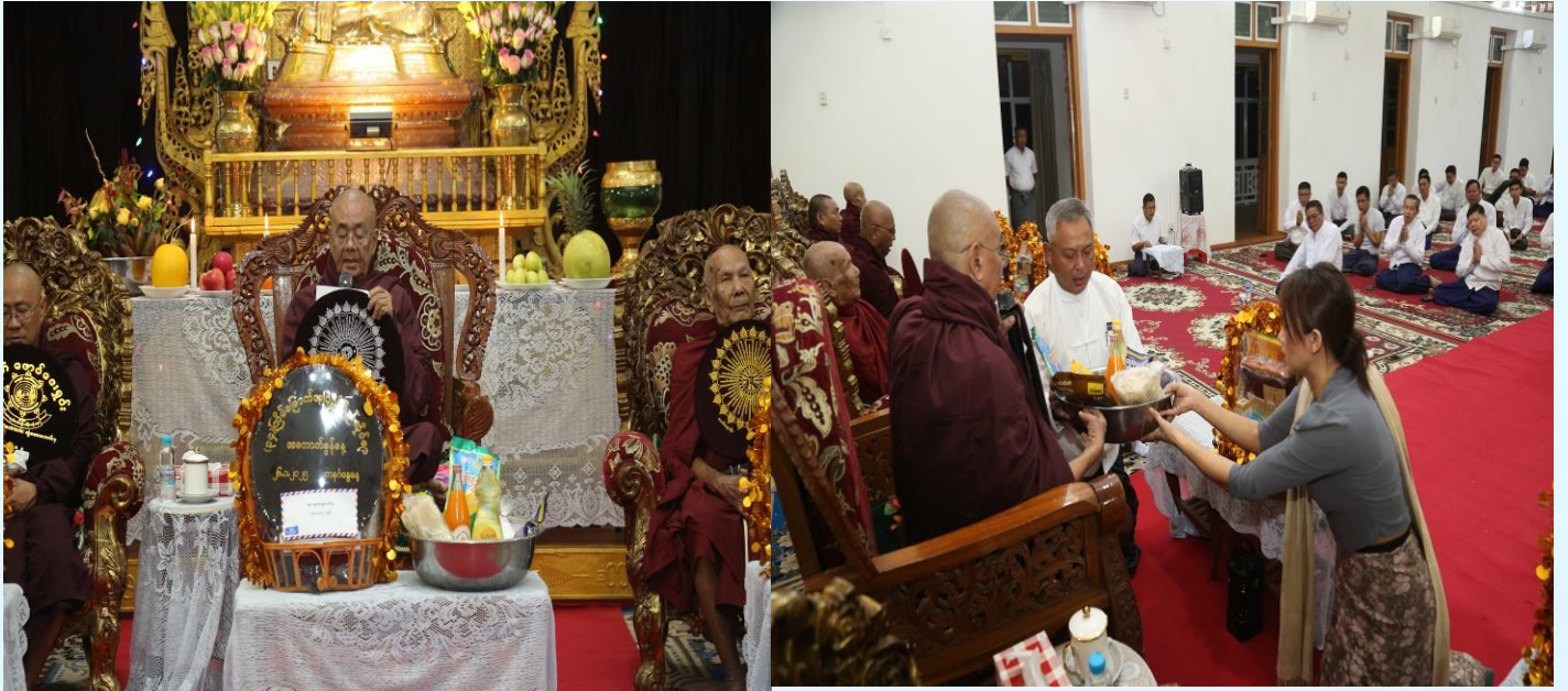
၂၀၂၅ ခုနှစ်၊ (၃၄) ကြိမ်မြောက်အပြည်ပြည်ဆိုင်ရာအကောက်ခွန်နေ့အခမ်းအနား အထိမ်းအမှတ်အဖြစ် ဗဟန်းမြို့နယ်၊ မင်းကွန်းတောရ ကျောင်းတိုက်၌ သံဃာတော်(၁၁) ပါးနှင့် သီလရှင် (၈၀) ပါးတို့အား ဒုတိယညွှန်ကြားရေးမှူးချုပ် (အုပ်ချုပ်မှုနှင့်စီမံရေးရာ) ဦးတင်ကိုထက် နှင့် ဇနီးတို့မှ အာရုဏ်ဆွမ်း ဆက်ကပ်လှူဒါန်းစဉ်။

ထို့နောက် စီမံကိန်းနှင့်ဘဏ္ဍာရေးဝန်ကြီးဌာန၊ ဒုတိယဝန်ကြီး ဦးမင်းထွဋ်သည် ဆုရရှိသူများနှင့်အတူ အမှတ်တရစုပေါင်းမှတ်တမ်းတင်ဓာတ်ပုံရိုက်ကူးခဲ့ပြီး အကောက်ခွန်ဦးစီးဌာန၏ တစ်နှစ်တာလှုပ်ရှားမှုမှတ်တမ်းဓာတ်ပုံများနှင့် အကောက်ခွန်သမိုင်းပြတိုက်အတွင်း လှည့်လည်ကြည့်ရှုခဲ့ကြပြီး ဧည့်သည်တော်