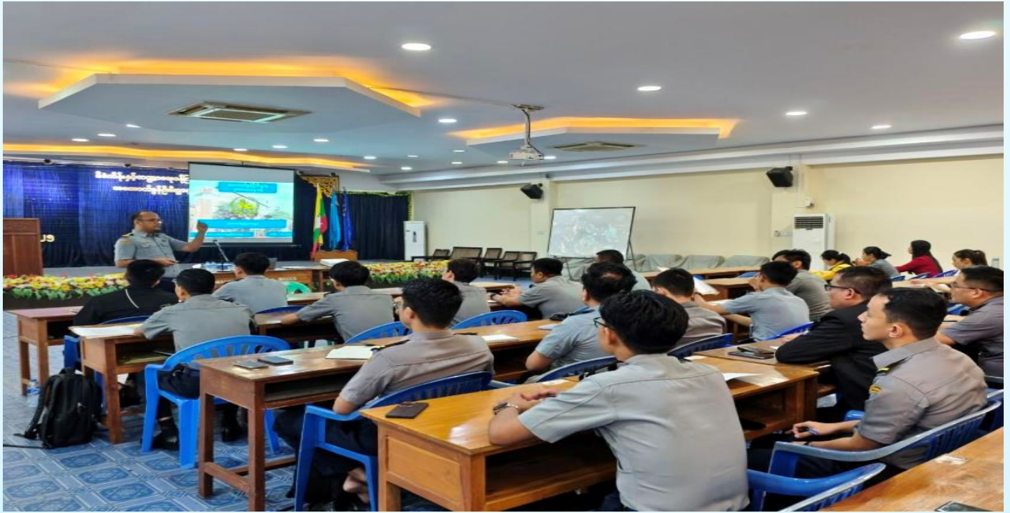
အကောက်ခွန်ဦးစီးဌာနမှ ဝန်ထမ်းများအား လုပ်ငန်းဆောင်ရွက်ရာတွင် ဥပဒေရေးရာဆိုင်ရာအသိပညာများ ပိုမိုမြင့်တက်လာစေရေးအတွက် အကောက်ခွန်ဥပဒေနှင့်ဆက်စပ် ဥပဒေများအကြောင်း သင်တန်းပို့ချစဉ်။

အကောက်ခွန်ဦးစီးဌာနရှိ ဝန်ထမ်းများအား အကောက်ခွန်ဥပဒေများကို ထိရောက်စွာအကောင်အထည်ဖော်ဆောင်ရွက်နိုင်စေရေး ဝန်ထမ်းများ၏အရည်အချင်း ပိုမိုမြင့်တက်လာစေရေးအတွက် အကောက်ခွန်ဥပဒေများဖြစ်သည့် ပင်လယ်ရေကြောင်းအကောက်ခွန်အက်ဥပဒေ၊ ကုန်းလမ်းအကောက်ခွန်အက်ဥပဒေနှင့် အကောက်ခွန်နှုန်းဥပဒေများအပြင် အကောက်ခွန်ဝန်ထမ်းများအနေဖြင့် မိမိတို့တာဝန်ယူဆောင်ရွက်သည့် အကောက်ခွန်လုပ်ငန်းများတွင် အကောက်ခွန်ဥပဒေနှင့် ဆက်စပ်ဥပဒေများ ချိတ်ဆက်မှုအား သိရှိစေရန်အတွက် ဆက်စပ်ဥပဒေများဖြစ်သည့် ပို့ကုန်သွင်းကုန်ဥပဒေ၊ နိုင်ငံခြားသုံးငွေစီမံခန့်ခွဲမှုဥပဒေနှင့် မြန်မာ့ကျောက်မျက်ရတနာဥပဒေတို့အား အကောက်ခွန်ဦးစီးဌာန (ရုံးချုပ်)၏ ဌာနခွဲ (၁၂) ခုမှ ဝန်ထမ်းများအား ၁၃-၂-၂၀၂၅ ရက်နေ့မှ ၁၄-၂-၂၀၂၅ ရက်နေ့အထိ အကောက်ခွန်သင်တန်းကျောင်း၊ သင်တန်းခန်းမ၌ ၈:၀၀ နာရီ မှ ၉:၃၀ နာရီအထိ သင်တန်းပို့ချခဲ့ပြီး သင်တန်းသားဦးရေ ( ၅၀ ) ဦး တက်ရောက်ခဲ့ပါသည်။